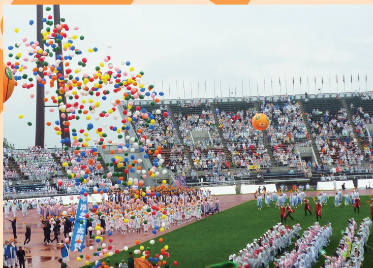
第17回 笑顔つなぐえひめ大会 開会式